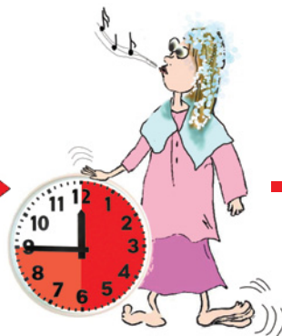
Timp de acțiune: de obicei 30-45 minute (respectați cu exactitate indicațiile prospectului însoțitor)