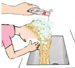
Părul îmbibat cu loțiune