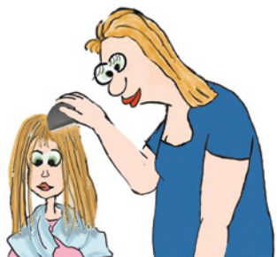
Pieptănați părul ud în prima, a 5-a, a 9-a și a 13-a zi.