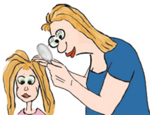
Examinarea zilnică a capului/părului