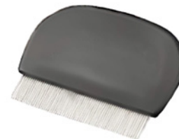
Pieptene special pentru îndepărtarea păduchilor